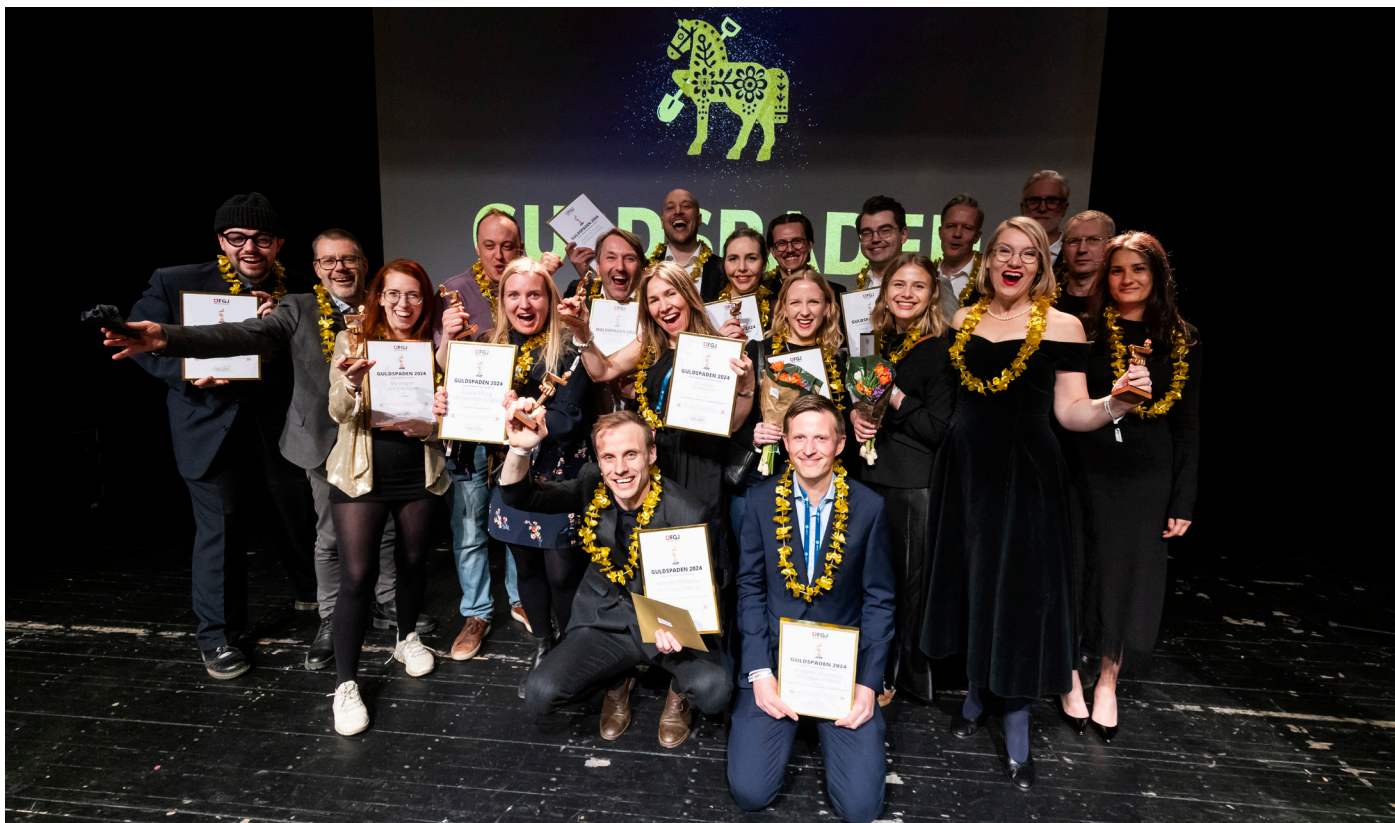
Alla vinnarna samlade i Borlänge.