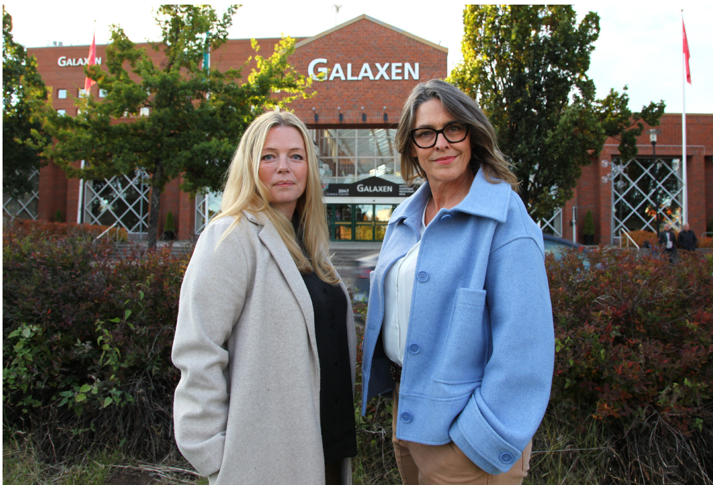
Grävgeneralerna utanför Galaxen i Borlänge.