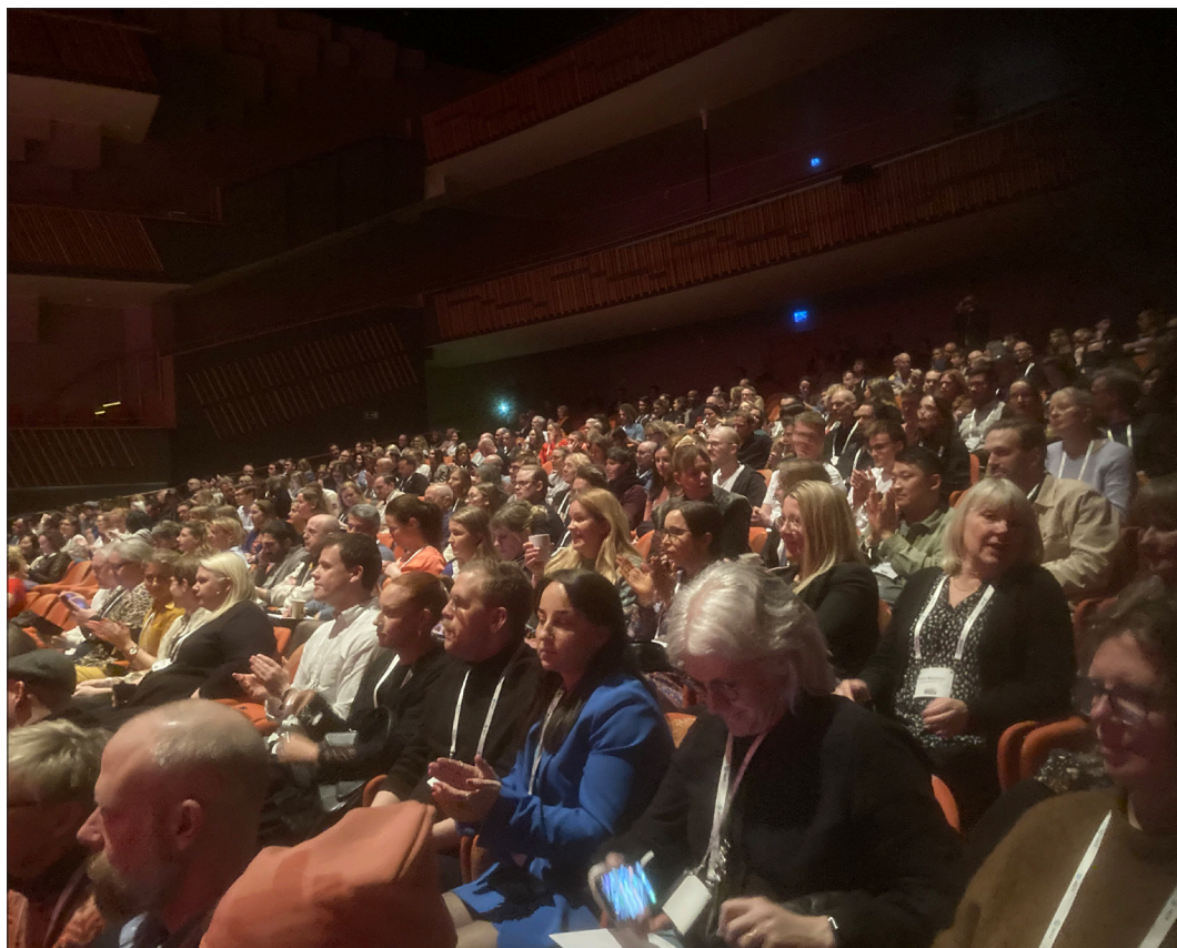
Gräv 23 i Karlstad.