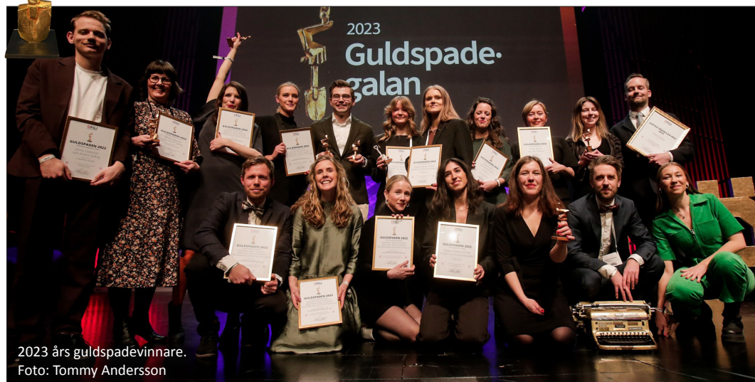
2023 års guldspadevinnare.

STUDENTSPADEN: Omvändelseterapi av Emilia Lindell, Emma Rosdahl, Nadya Abbasi (JMK, Stockholms universitet)