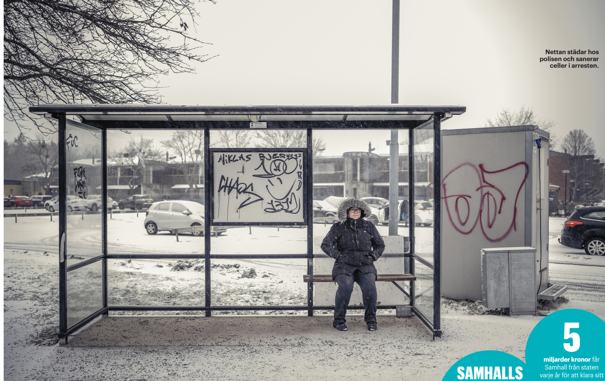
Nettan städar hos polisen och sanerar celler i arresten.