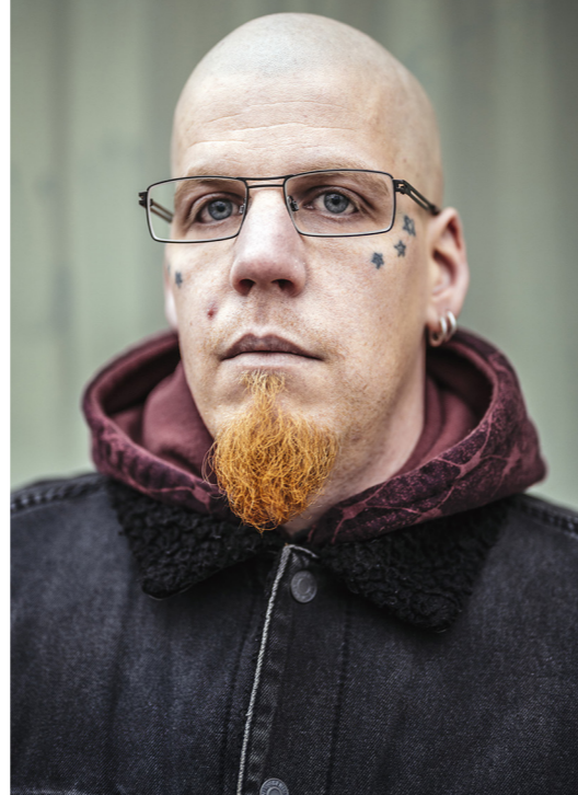
Johan vars pappa dog.

” Vi får inte städa bilarna på ett säkert sätt för interiören kan torka och spricka. Men ett liv är väl mer värt än en ratt? ”