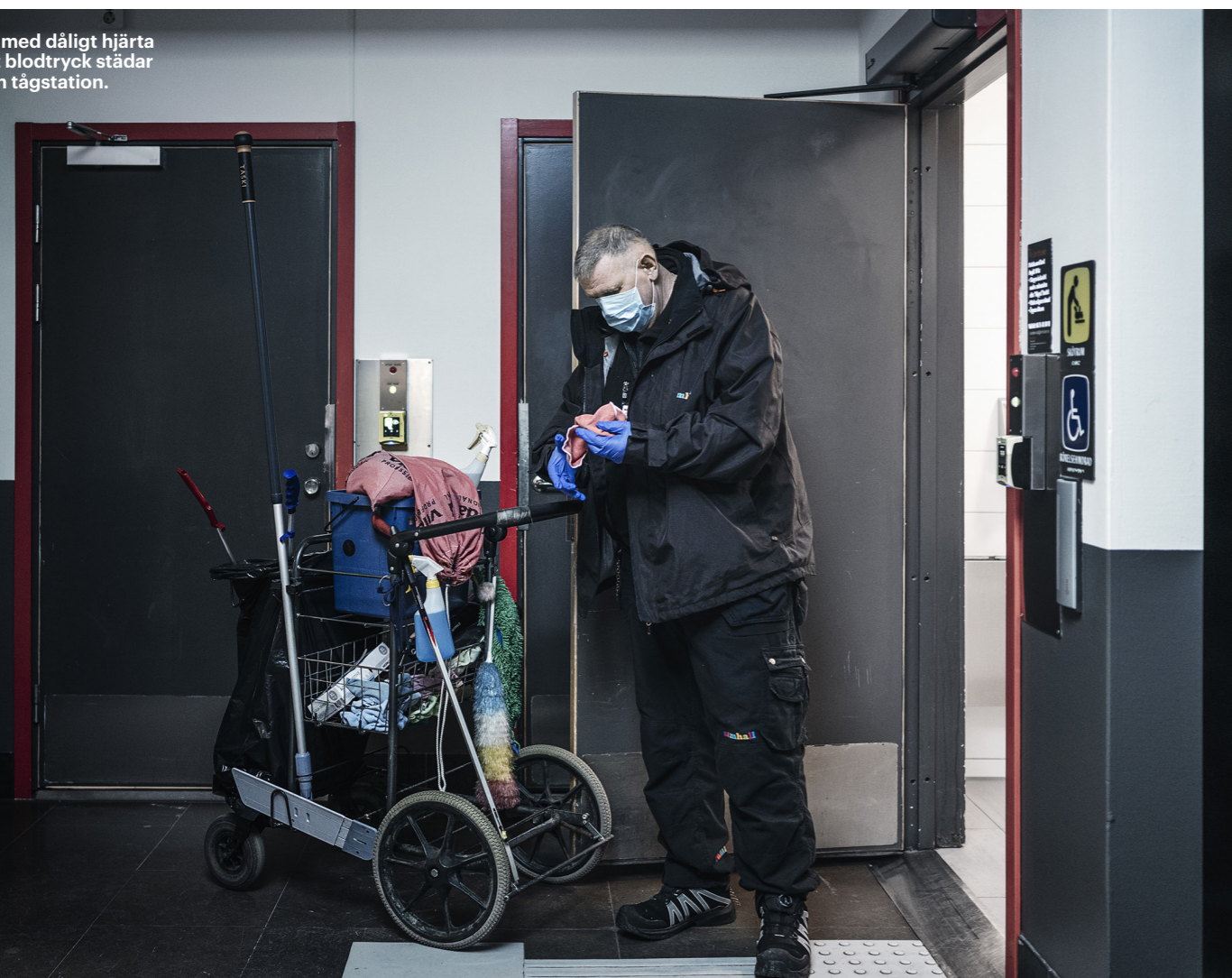
Serafino med dåligt hjärta och högt blodtryck städar ensam en tågstation.

2021 Samhall får ny vd, Sara Revell Ford. ❄