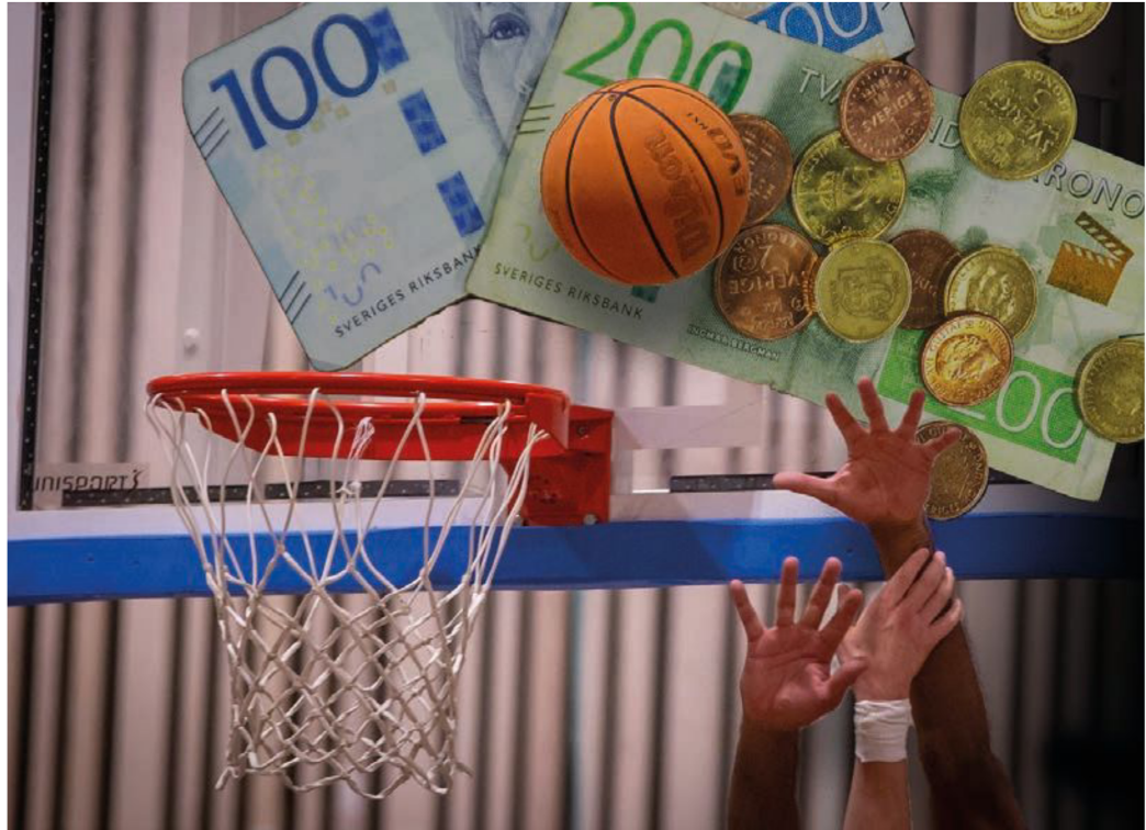
En tidigare spelare berättar om hur han blev lovad kontrakt som han sedan aldrig fick.

Basket på den nivån, pengarna är inte så stora. Många spelare studerar vid sidan om. Vi var inga superstjärnor som tjänade massor med pengar. Nej, nej det handlade om en liten summa pengar.