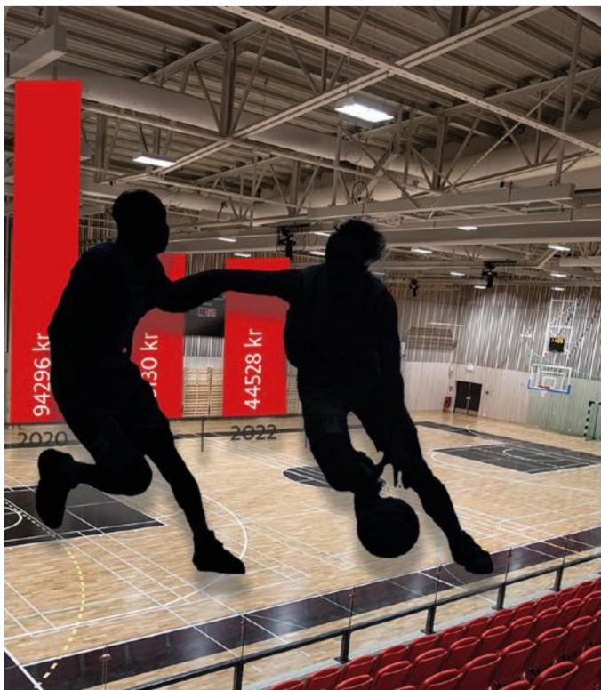
verksamhetsbidrag från kommunen sedan 2017.