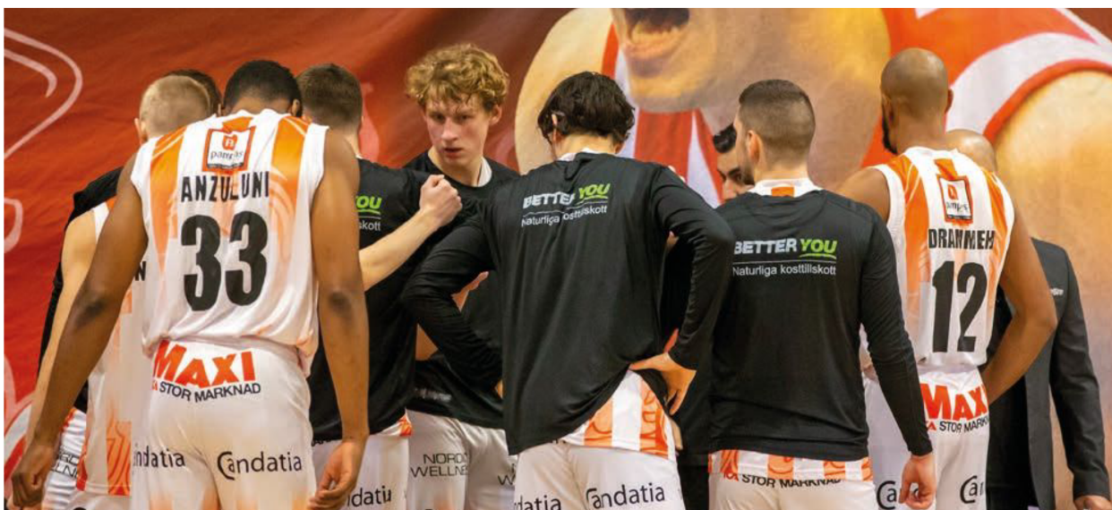
Trelleborg Pirates har inlett superettan på övertygande sätt och besegrade AIK hemma i söndags. Utanför plan är problemen desto större – risken finns att laget blir uteslutet ur serien.