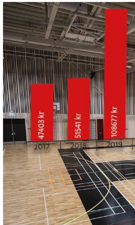
Trelleborg basket har totalt fått 392 575 kronor i