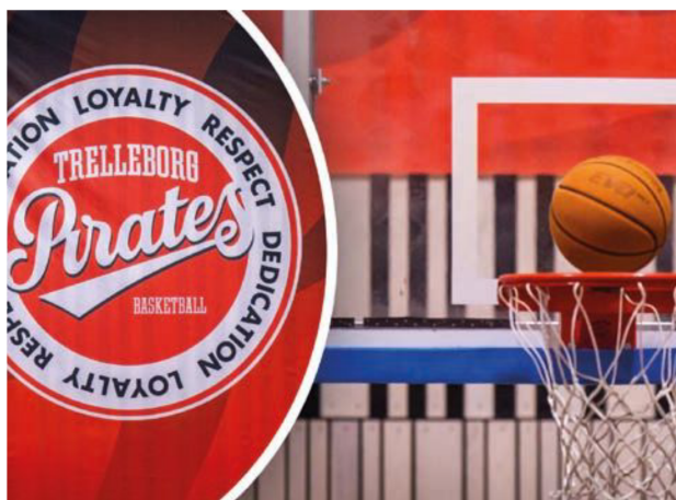
Trelleborg baskets nya ordförande uppger att Skatteverket nu granskar föreningen.

Och i det är det lätt att tänka på ordspråket "Också tystnaden talar".