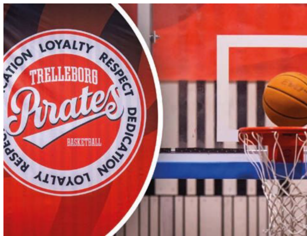
A-laget Trelleborg Pirates blev på måndagen uteslutna ur den näst högsta basketserien.

– Hon blev inte så glad givetvis, hon blev tyst, säger Lundén.