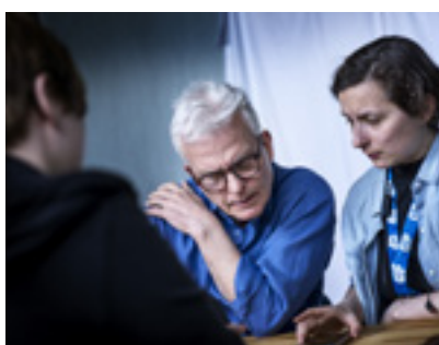
GP:s Per Sydviik och Anastasiia Palchuk har träffat ukrainska kvinnor som utnyttjats för städjobb med löner långt under kollektivavtal. Kvinnorna vittnar om en ständig rädsla för att åka fast och deporteras.

GP:s granskning visar att ukrainskor som städade för Alberts inte haft tillstånd att arbeta i Sverige. Men vi vet inte om Alberts underleverantörers underleve-