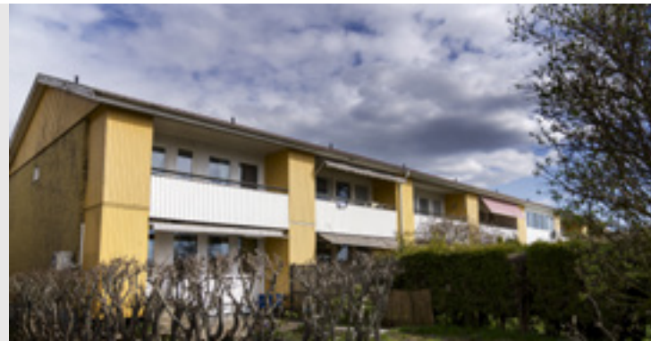
Bland annat i den här fastigheten har det bott städpersonal från Ukraina.

Ukraina. Arbetskraft rekryteras i Ukraina via sajter och sociala medier. Bilder och filmer på bostäder till städarna visas, bland annat i Göteborg.