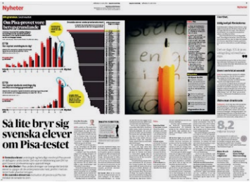
DN den 16 juni.

Studien Timss mäter kunskaper i årskurs åtta. Vid undersöknings-tillfället skrivs inga nationella prov.