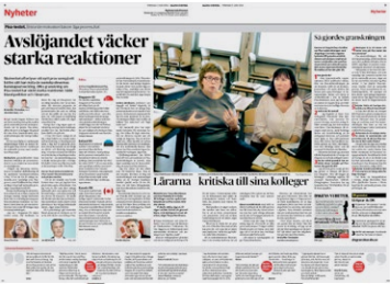
DN den 5 juni.