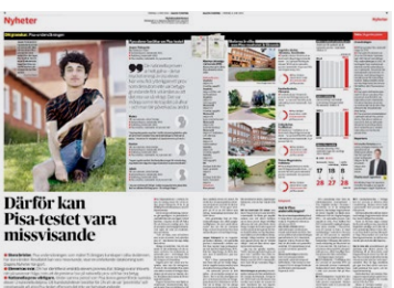
DN den 4 juni.

Timss visar att resultaten har försämrats för Sveriges del, men inte lika mycket som Pisa-resultaten.