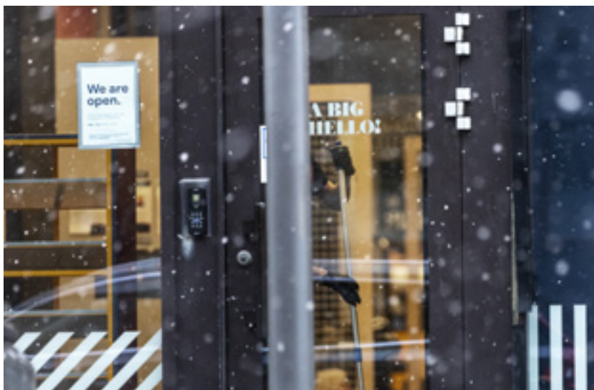
Ukrainska underbetalda städare har till exempel anlitats för jobb på gymkedjan Fitness 24Seven.