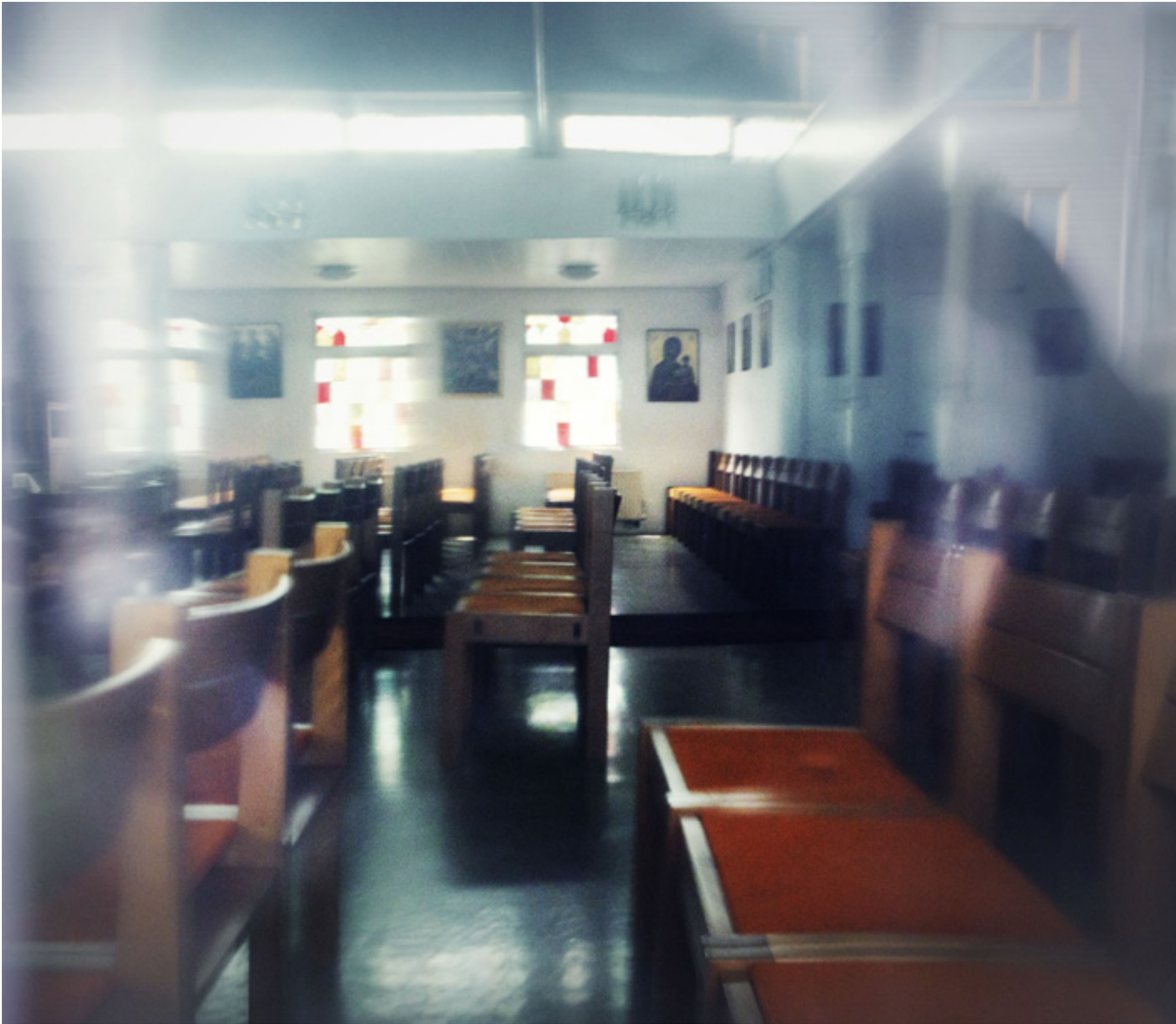
Kyrkan har ägts av lokalföreningen i Göteborg sedan 1998, då mängder av västsvenska grekiska arbetare gick samman för att ordna grekernas första kyrka på västkusten.