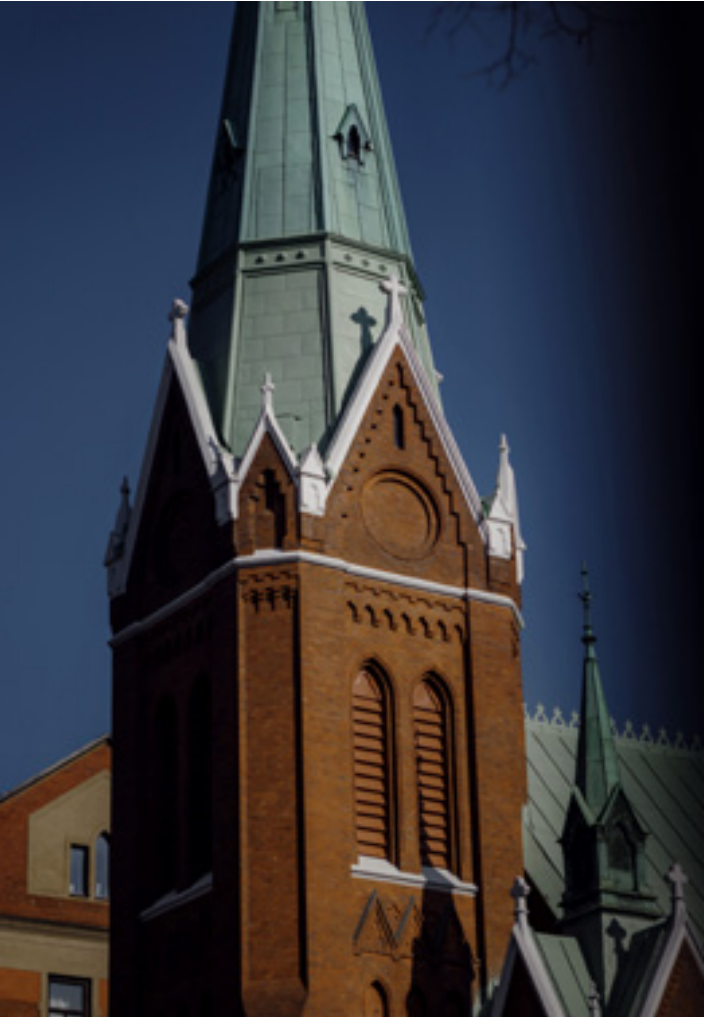
Bilder: Stockholms stad, Sanna Tedeberg

Bland de högt uppsatta källorna inom kyrkan väcker svartbygget och husaffären, som båda gjordes med bara månaders mellanrum under 2019, stora varningsflaggor.