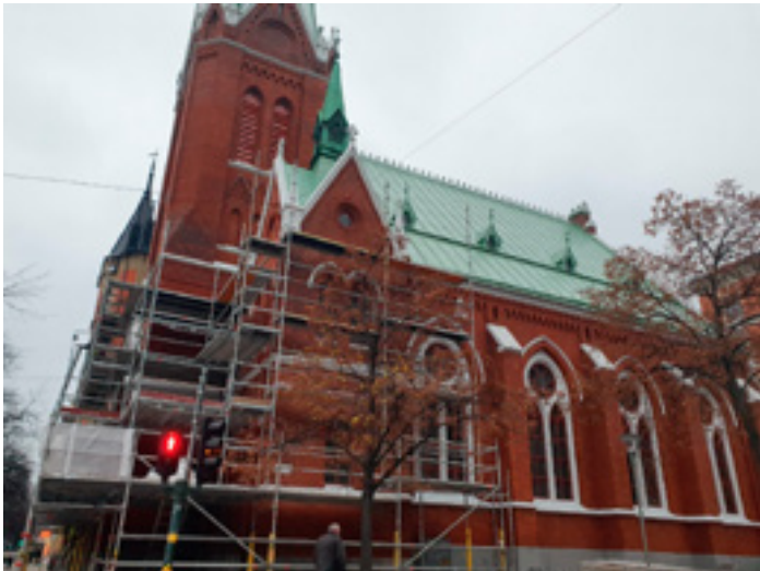
2019 renoverades Sankt Georgios kyrka. Men metropoliten ansökte varken om bygglov eller anmälde renoveringen av den k-märkta kyrkan till Länsstyrelsen – som kallar renoveringen för ett svartbygge. Arga grannar kallar kyrkan för pepparkakshus, sedan de grå stendetaljerna under renoveringen målats vita.