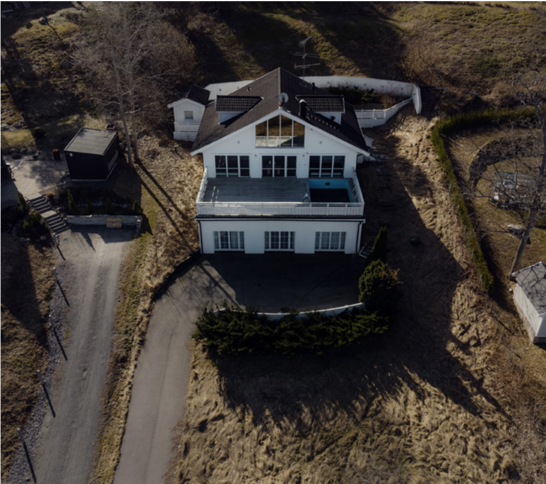
Sommaren 2019 köpte grekisk-ortodoxa kyrkan en villa i Stockholms skärgård. I priset – nio miljoner kronor – ingick havsutsikt, dubbla terasser och swimmingpool.

Text: Michael Verdicchio