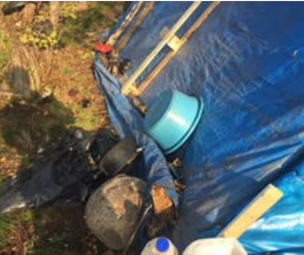
Runt omkring tälten ligger bråte och kläder.