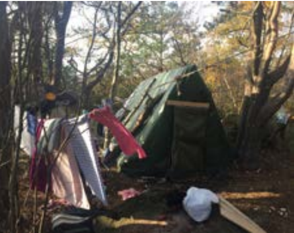
Mellan tälten hänger linor med tvätt.