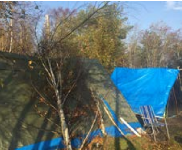
I en skogsdunge har ett tältläger växt fram.

Det är Social resursförvaltning som har i uppdrag att arbeta med EU-medborgarna i Göteborg. I det arbetet samarbetar de med idéburna organisationer i ett så kallat IOP-avtal. Det innebär bland annat att kommunen finansierar en del av Räddningsmissionens och Frälsnings-