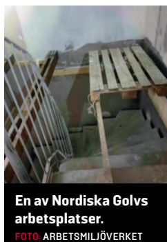
En av Nordiska Golvs arbetsplatser.

– Det är lustigt att de står som kontrollerade, eftersom jag till exempel aldrig vet om jag får svart eller vit lön, säger han. ●