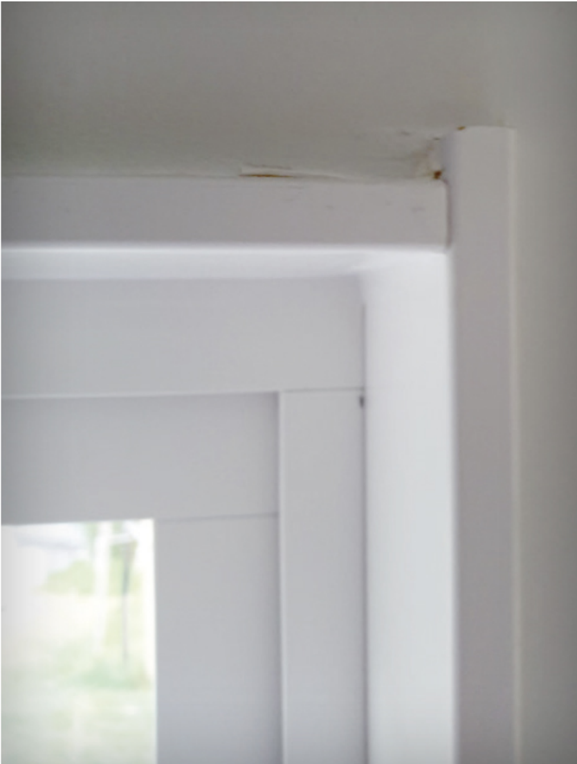
Bilder från Peters mardrömsbygge. När han vägrade betala fullt pris blev byggaren hotfull.

Resultatet blev stora knölar i betongen och stenar som stack upp. Kanske var det inte så konstigt, med tanke på att jobbet gjordes av en före detta lastbilschaufför och en kock.