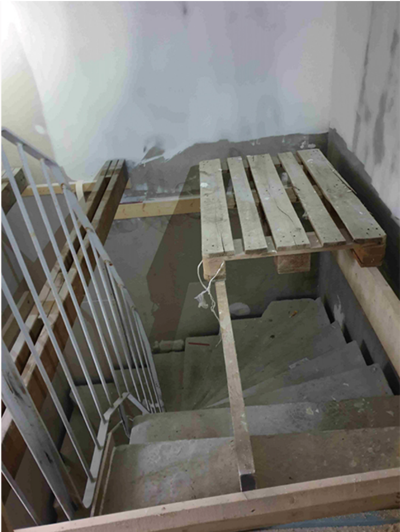
Från Nordiska Golvs arbetsplatser.

Arbetarna säger att de har jobbat utan vitala skydd och utsatts för fara på jobbet. Och när vi tittar på handlingar från Arbetsmiljöverket blir det tydligt att Nordiska Golv har haft stora problem med arbetsmiljön. I inspektioner och beslut påpekas mängder av brister som gett böter och föreläggande om böter. Här är några av kommentarerna från arbetsplatserna: