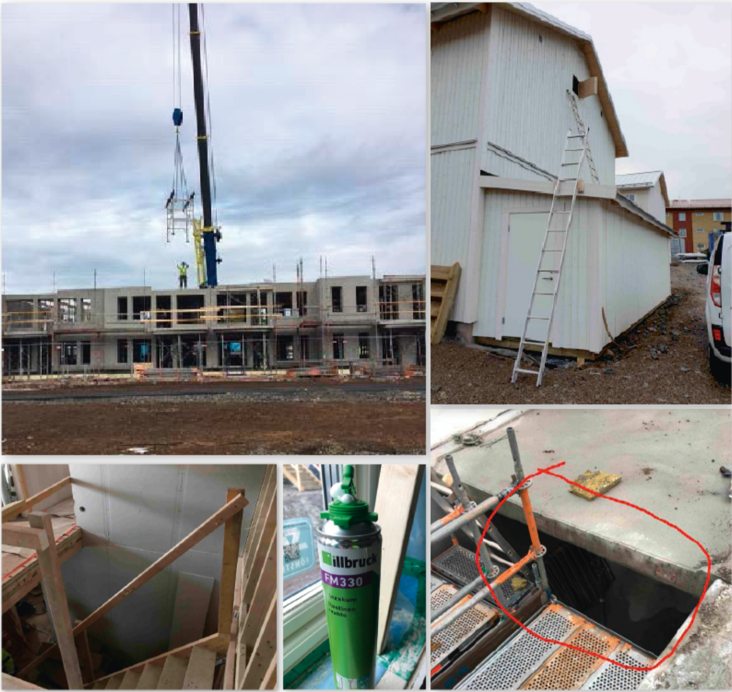
Bilder från Arbetsmiljöverkets inspektioner hos olika Gasellbolag.

I kategorin som ofta handlar om livsfara har gasellbyggarna fått böter eller hotats med böter 64 gånger vid incidenter som höghöjdsjobb utan fallskydd och asbestexponering. Bolagen har också registrerats för 626 arbetsskador**.