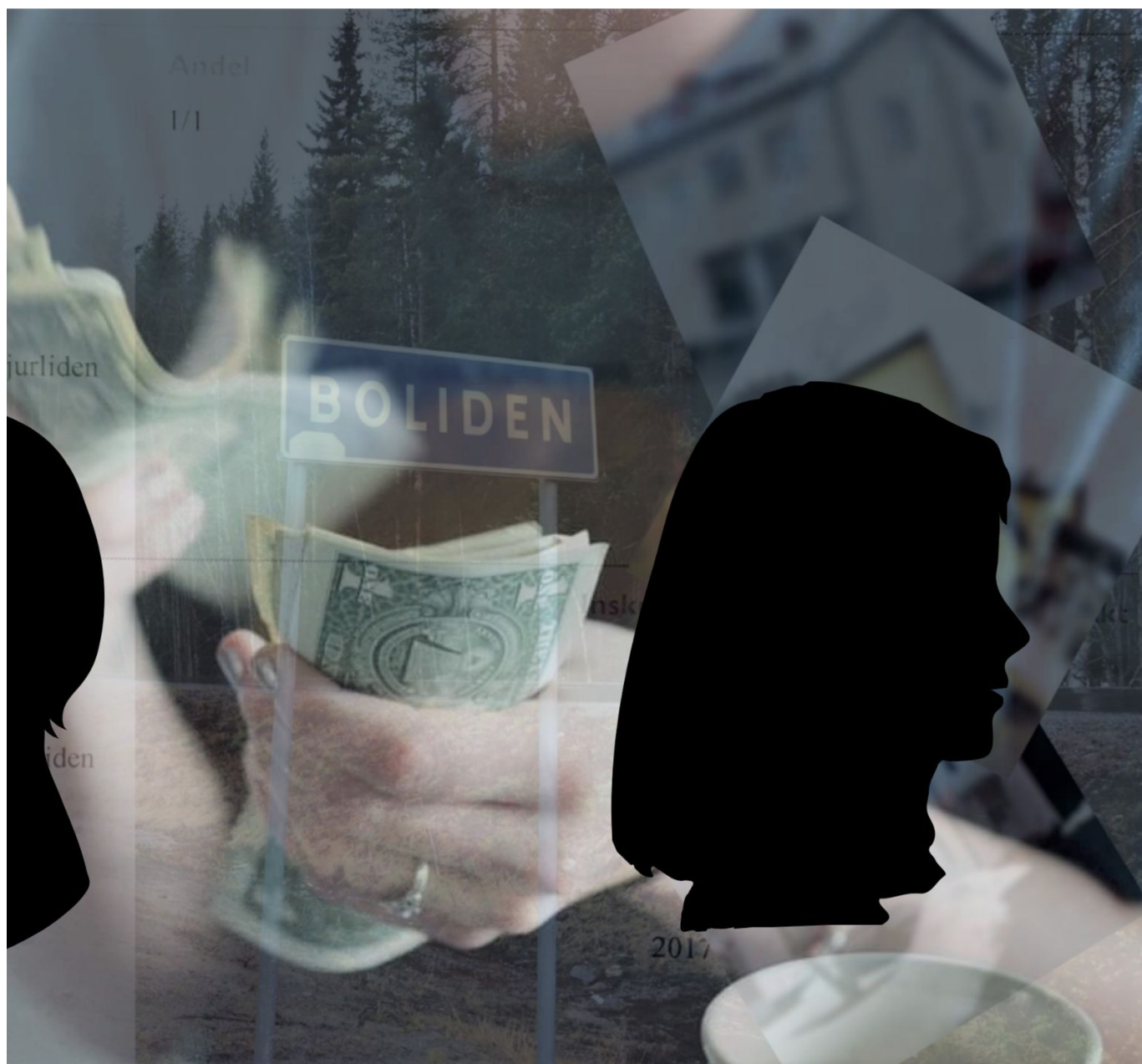
en annan person står bakom affärerna.