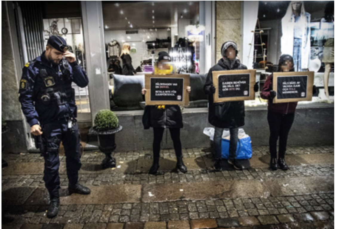
Demonstration utanför en butik i Göteborg.

– Anledningen är det skäl som Justitiedepartementet angett i skri-