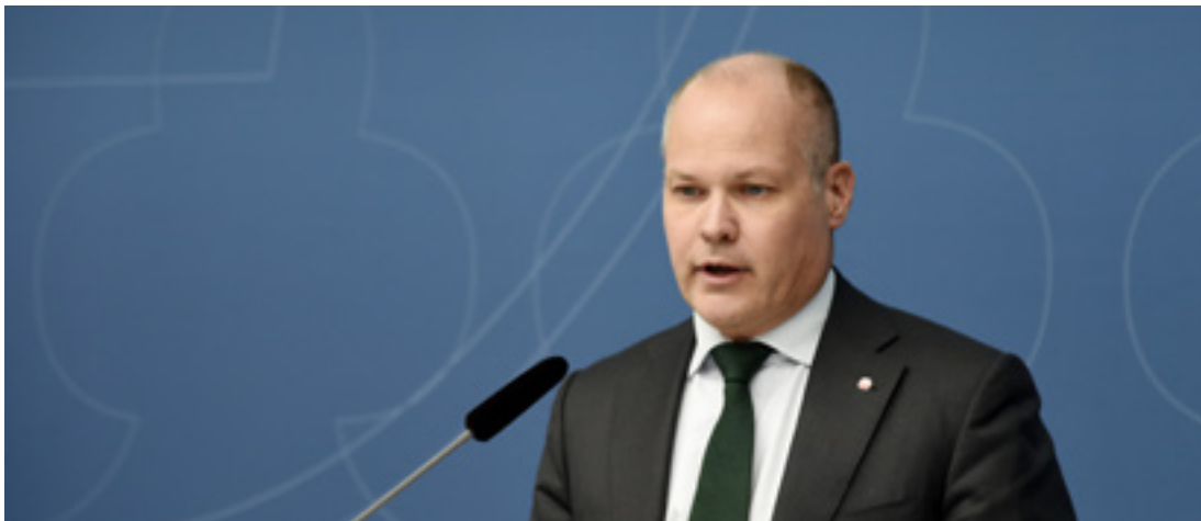
Justitie- och migrationsminister Morgan Johansson (S) presenterade det nya förslaget under en debatt i riksdagen.

Samtidigt presenterade han ett helt nytt förslag om att skärpa lagstiftningen kring olaga intrång och hemfridsbrott, efter kritik från bland annat Lantbrukarnas Riks-