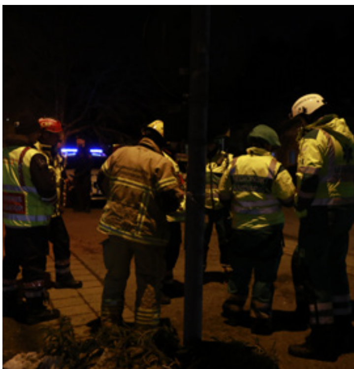
Räddningstjänsten ryckte ut på begäran av polisen.

Anders Abrahamsson Magnus Vasell nyheter@gp.se