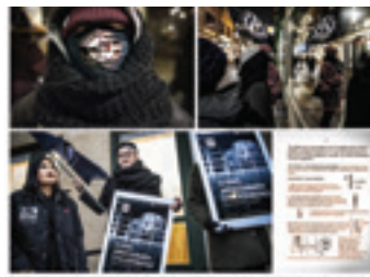
Djurfront sprider manual med bombinstruktioner