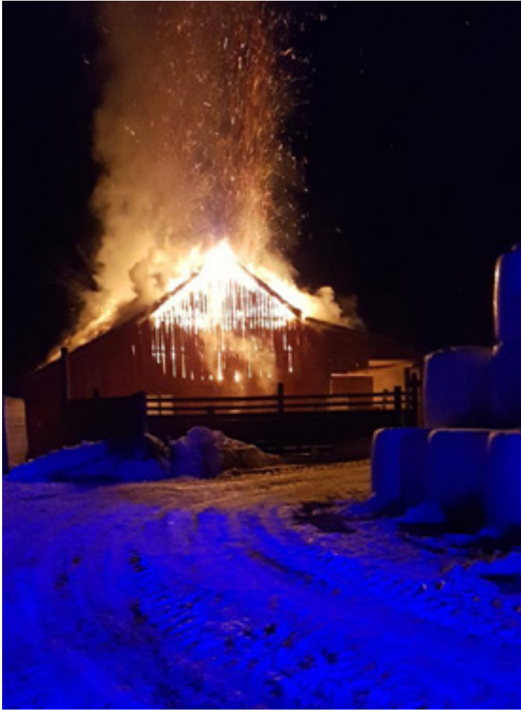
I mars 2018 konfronterar en västsvensk fårbonde en grupp djurrättsaktivister som trakasserat och dödshotat hans vänner. Samma natt vaknar bondens fru och barn av att deras gård brinner.