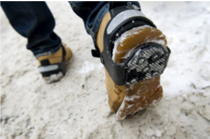
På med broddarna i vinterhalkan.