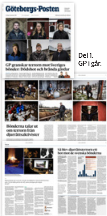
Del 1. GP i går.