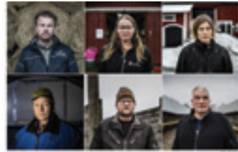
GP granskar terror mot Sveriges bönder: Dödshot och brända gårdar

– Det är inget jag planerat. Det skulle kanske inte vara värt det. Skulle det ske ett mord, så skulle djurrättsrörelsen kanske bli terrorstämplad. Men om någon skulle göra det så tror jag många skulle