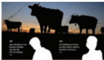
Barn drabbas: "De säger att de kanske ska döda mamma"