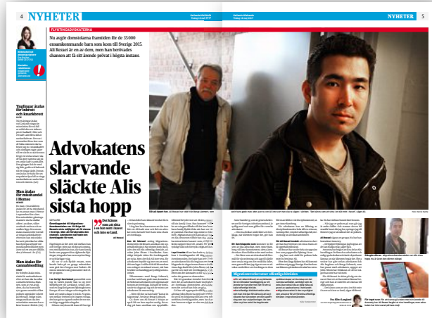
GA i tisdags.