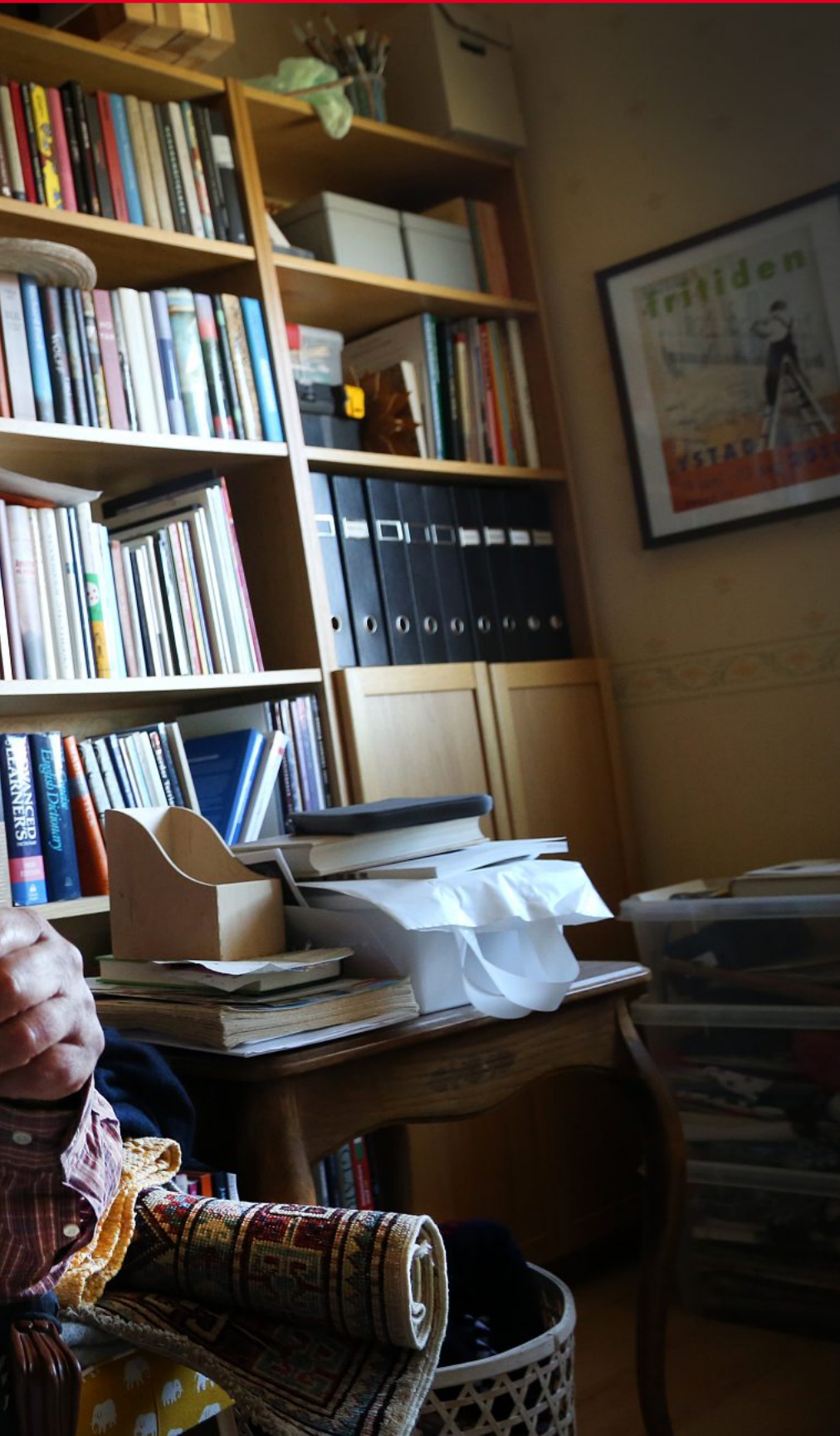
engagemang i sina klienter kan variera stort.