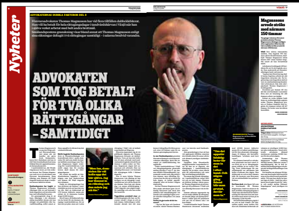
Smålandsposten den 11 maj.