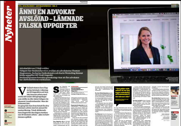
Smålandsposten den 15 juni.

att tingsrättsdomen avkunnats. Men domstolen hade då redan sänkt hennes begärda arvode med 130 000 kronor av helt andra orsaker efter en skälighetsbedömning.