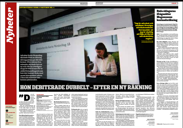
Smålandsposten den 13 maj.