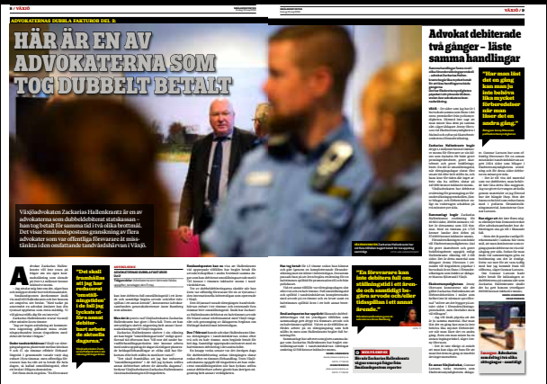
Smålandsposten den 10 maj.