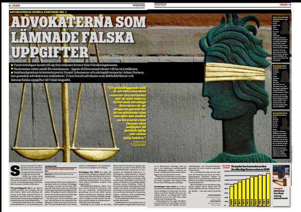
Smålandsposten den 9 maj.