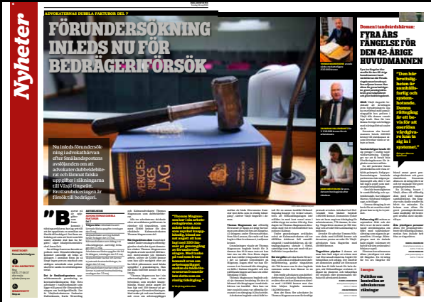
Smålandsposten den 16 maj.