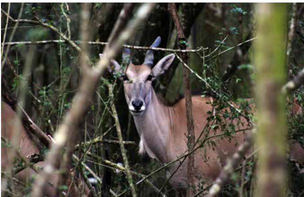
Eland är en kraftig antilop och en art i familjen slidhornsdjur.