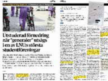
Barometern den 24 augusti.

Tidigare delar: 24/8: Utstuderad förnedring när "generaler" valdes ut i LNU:s största studentförening. 25/8: Spyhinken räckte inte till – ambulans fick tillkallas efter generalernas spritfest.