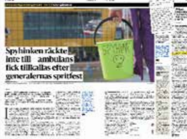
Barometern den 25 augusti.

Vi fick för flera år sedan reda på att det varit vissa problem med en så kallad nollning. Några detaljer kring exakt när, var, hur och vem framkom däremot inte.