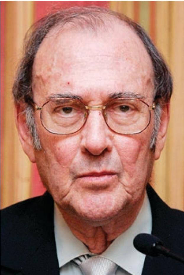
Andra pristagaren som läcktes: Harold Pinter, 2005.