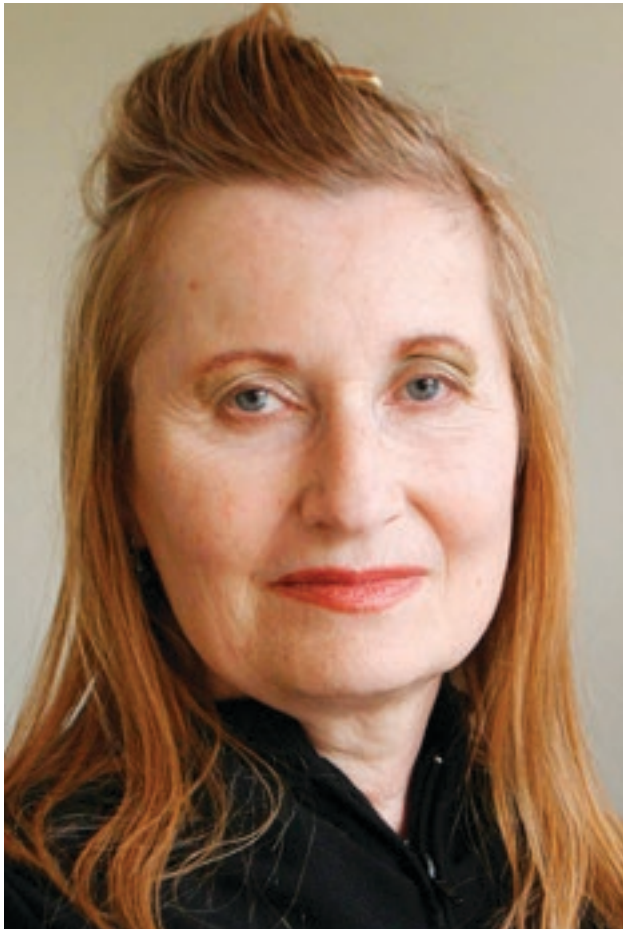
Första pristagaren som läcktes: Elfriede Jelinek, 2004.