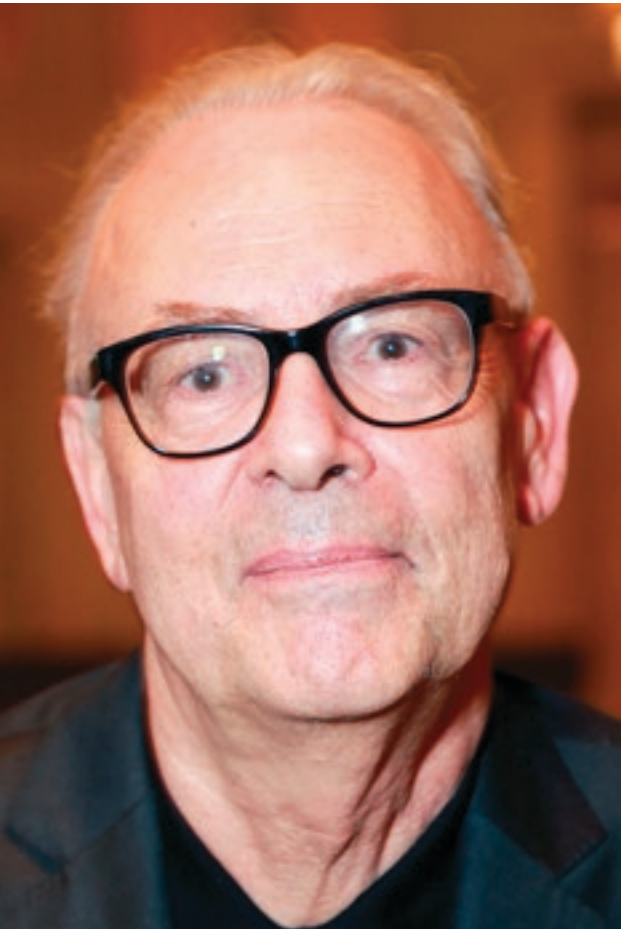
Tredje pristagaren som läcktes: Patrick Modiano, 2014.