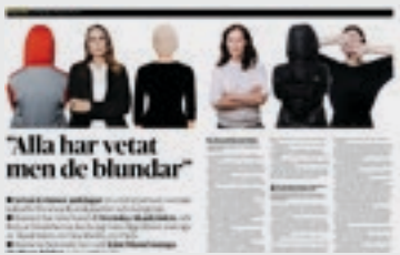
DN Kultur 22 november.

har han nyligen offentligt hyllats av en av de andra ledamöterna och driver verksamhet som har samar-betat med och mottagit finansiellt stöd från Svenska Akademien. ● Flera av de övergrepp som han anklagas för ska ha skett i Akademiens lägenheter i Paris respektive Gamla stan i Stock-