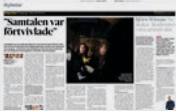
DN Kultur 25 november.

● Torsdagen den 28 november , vid ett av Akademiens ordinarie sammanträden, framkom även att