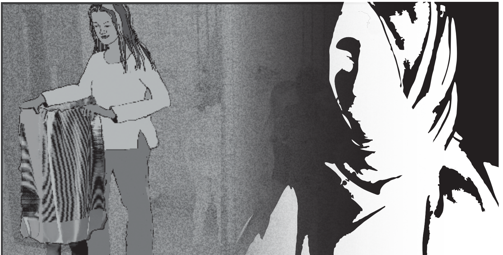
Illustration till vänster: MARIA KRISTOFFERSON Montage: DAN-TAGE AUGUSTSSON

Ring: 031-17 20 10 E-post: 72010@gp.se SMS/MMS: 720 10