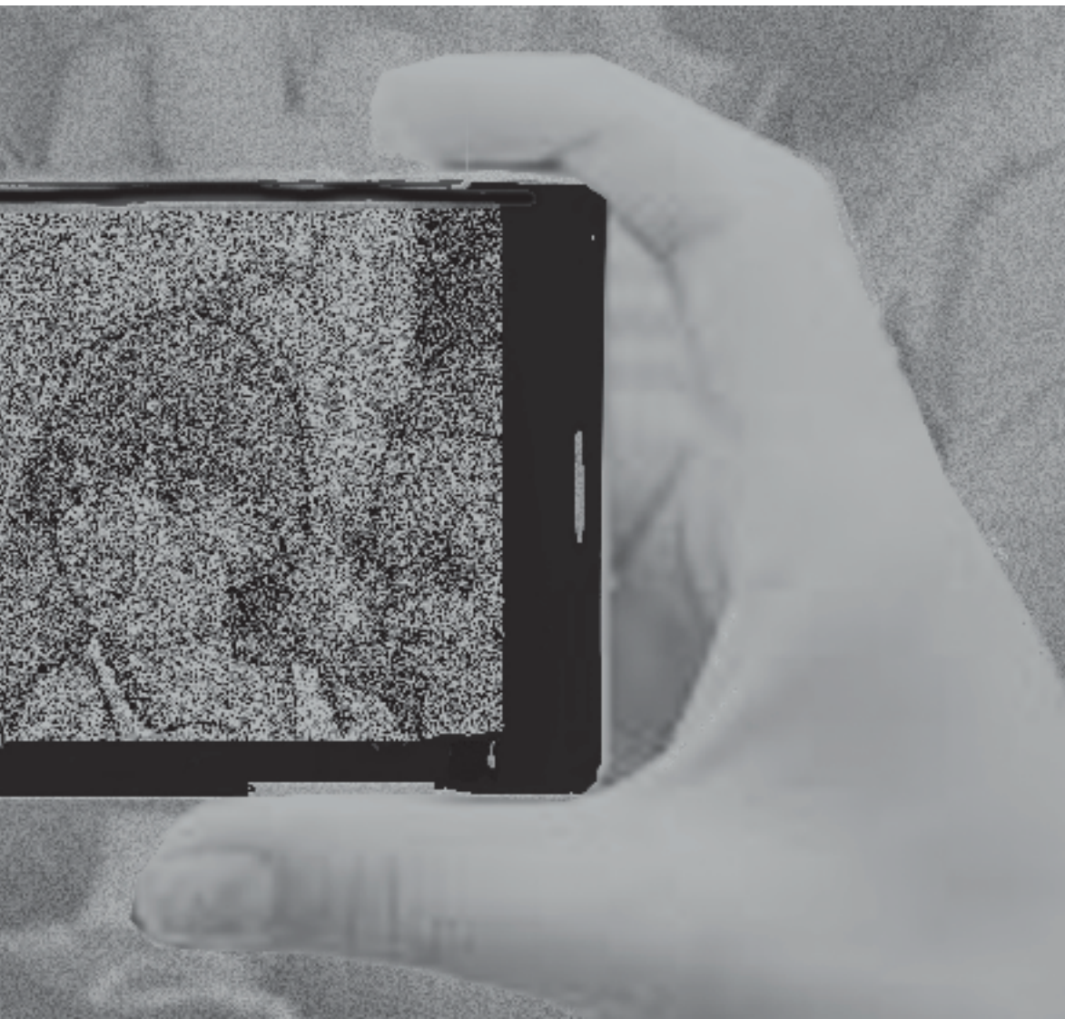
Illustrationer: MARIA KRISTOFFERSON

● Förskola filmar flicka via Facetime för att föräldrarna ska kunna kontrollera att hon inte tar av sig slöjan under skoltid.