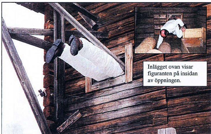
Flygbild på brödernas gård i Kalamark. Grannen såg mördarens ben sticka ut genom en glugg i ladugården (rekonstruktion). Spår i snön: Mördaren hade gått igenom skarsnön på flera ställen.

lästmått, alltså innermåttan på skorna, och de yttre måtten.