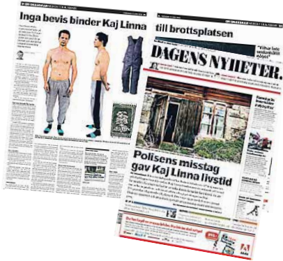
DN den 14 och 15 juni 2006.