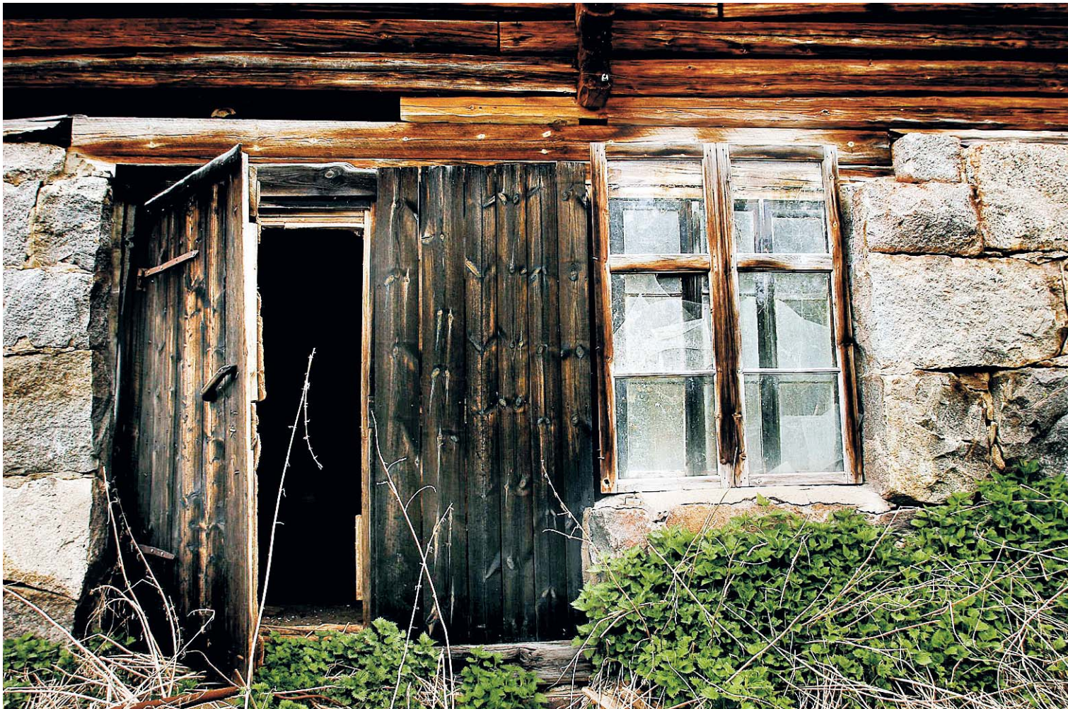
Ladugården i Kalamark står i dag öde. Ena brodern döddes, den andre skadades svårt vid överfallet.

JONAS THENTE: Man kan i alla fall trösta sig med att de unga sviker de politiska ungdomsförbunden. Kultur 4