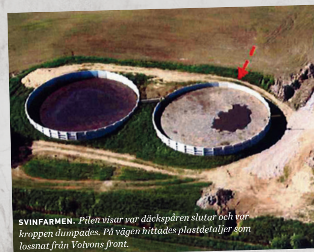
SVINFARMEN. Pilen visar var däckspåren slutar och var kroppen dumpades. På vägen hittades plastdetaljer som lossnat från Volvos front.